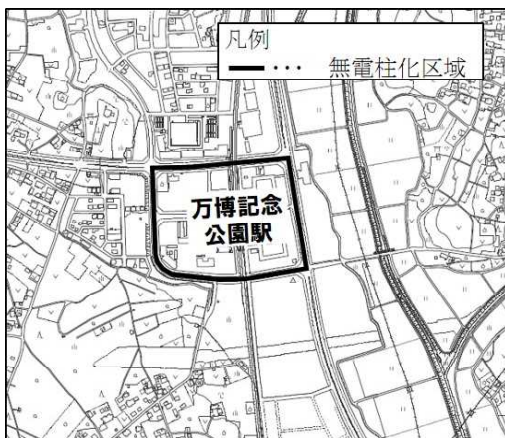
万博記念公園駅周辺