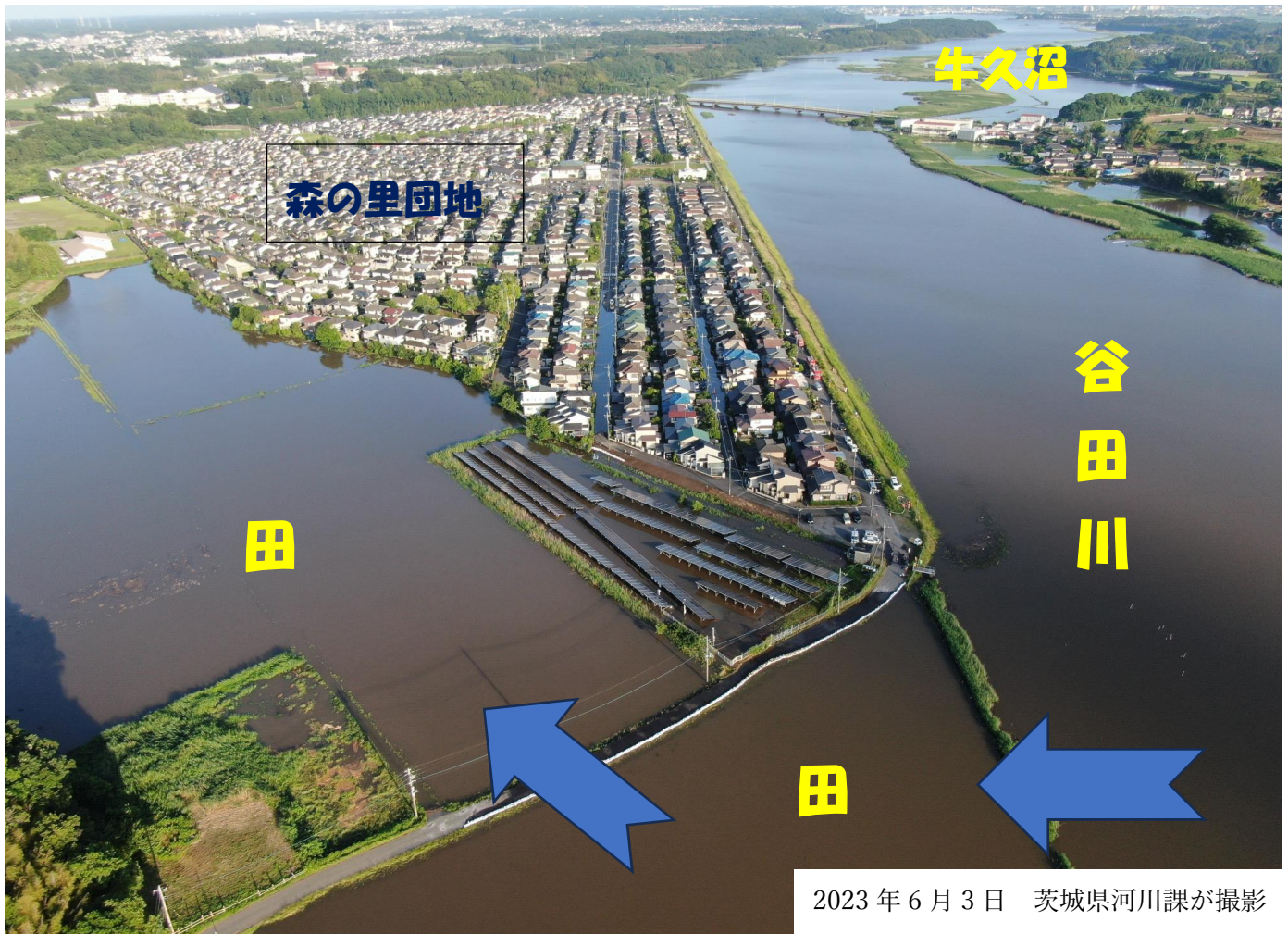
2023 年 6 月 3 日