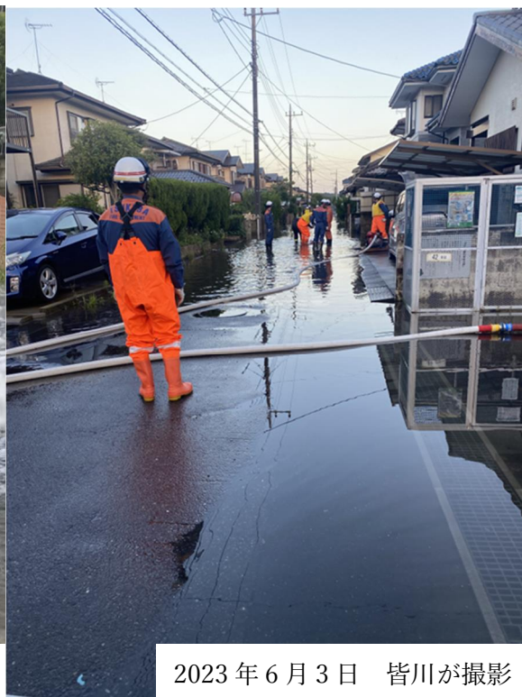
2023 年 6 月 3 日