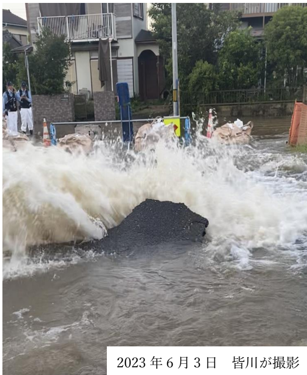
2023 年 6 月 3 日