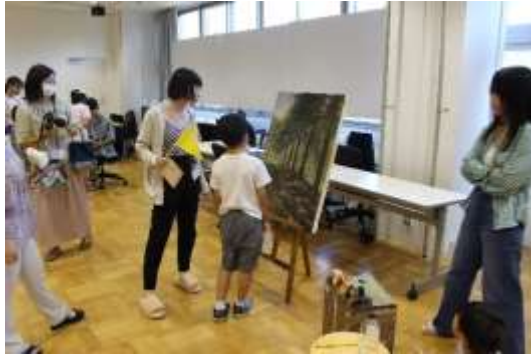
アートたんけん隊の様子