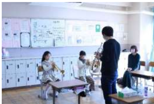
楽器体験の様子 (吾妻中にて)