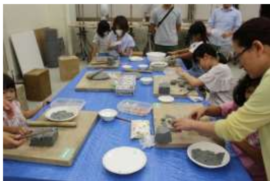
アートメダル制作の様子