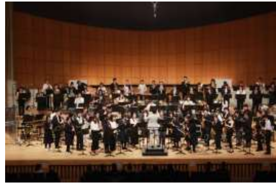
プロのメンバーと中高生バンドの共演