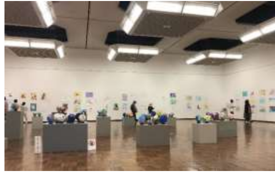
つくば美術館 展示風景