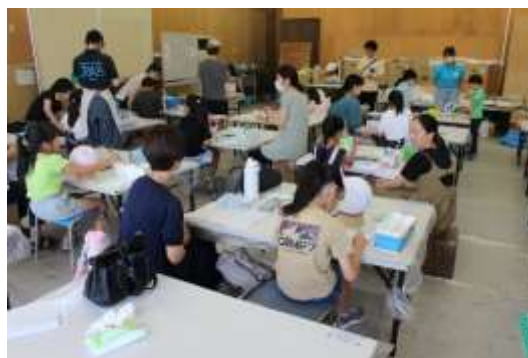
リボンアートボール制作の様子