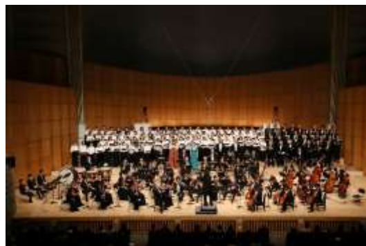
第 16 回つくばで第九 コン서트本番

“新生第九”のローガンの下、合唱指導に富澤氏ほかを迎え 8 月に初心者向け練習を、9 月からは全体練習・パート練習をスタートさせた。全 23 回の練習を重ね、昨年より 10 人以上多い総勢 113 人で本番に臨んだ。昨年好評だった合唱体験企画「歌い場」(参加無料)も先行して 7 月に実施し、「歌い場」参加者から合唱団に加わる団員もみられた。