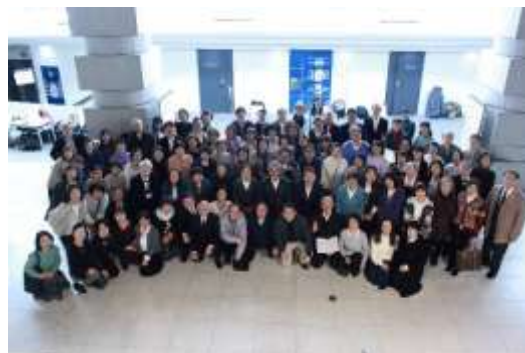
本番後の講師、合唱団の交流会