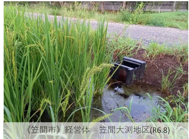
《笠間市》 経営体 笠間大洲地区(R6.8)

雨水貯留機能を持つ水田の重要性を地域の皆さんにご理解いただき、身近な対策で、お住まいの地域を守っていきましょう。