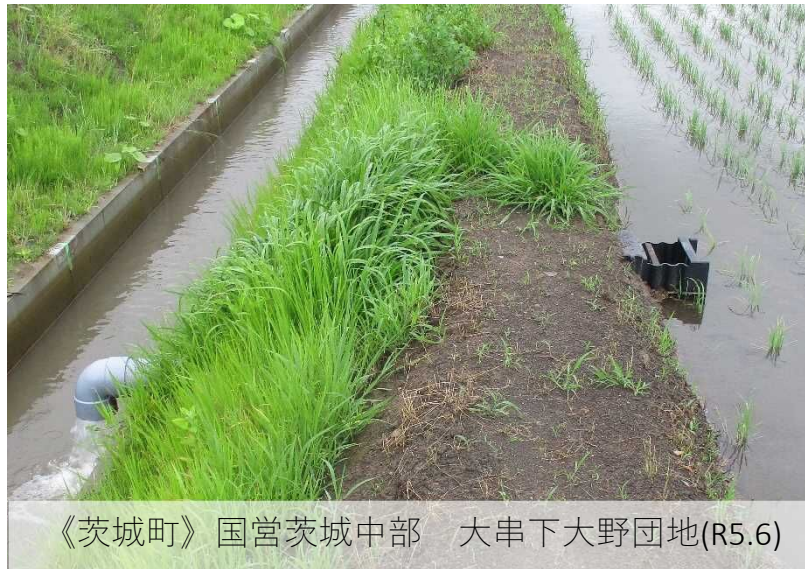
《茨城町》 国営茨城中部 大串下大野団地(R5.6)